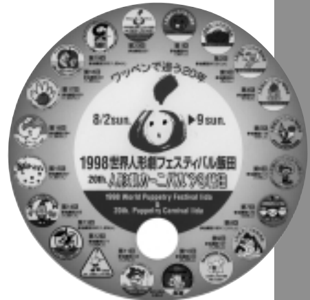
第1回から第20回までのワッペンをあしらった記念の回廊。

今回は人形劇カーニバル飯田の20回記念として一人遣いの人形ばかり、浄瑠璃だけでなく、新内・文弥節・せりふ芝居とその形態も様々なものを北は東北から、南は中国・四国まで、今も活躍している伝統人形芝居10座の競演であった。東北からは庄内出羽人形芝居をはじめ秋田猿倉人形芝居・吉田千代勝一座、青森の津軽伝統金多・豆蔵人形座の三座が参加し、約20年ぶりの競演が実現した。その他の参加は、西知人形座・朝日若輝一座(高知県)、尻高人形・錦松会(群馬県)熊毛安田の糸あやつり人形芝居保存会(山口県)、ひとみ座乙女文楽(神奈川県)、糸あやつり・喜の会(東京都)、佐渡・文弥人形大崎座(新潟県)、そして八王子車人形西川古柳座(東京都)であった。