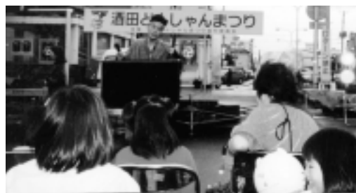
歩く人形劇場のくすのき燕