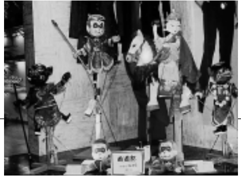
市内の商店には、各人形劇団の人形が展示されている。ウィンドー人形展。

長野県飯田市で人形劇カーニバルが始まったのが1979年で 昨年は20回記念ということもあり、海外からは11ヶ国、 12の劇団が参加し、国内からはプロ劇団からアマチュア劇団まで 約140劇団が参加しての大きなカーニバルとなりました。 そして、参加人数は世界各地、日本全国から、2,500人に及ぶ 人形劇人が集って記念すべき20回目のカーニバルが行われました。