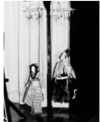
糸あやつり・喜の会の人形が出番を待つ寿式三番叟と八百屋お七。