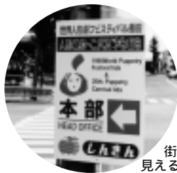
街角に見える案内板。