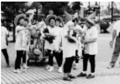
ママさん人形劇団も参加の人形劇人パレード。

八王子車人形、西川古柳座(国記録選択無形文化財)五代目古柳氏による上演。「東海道中膝栗毛」。